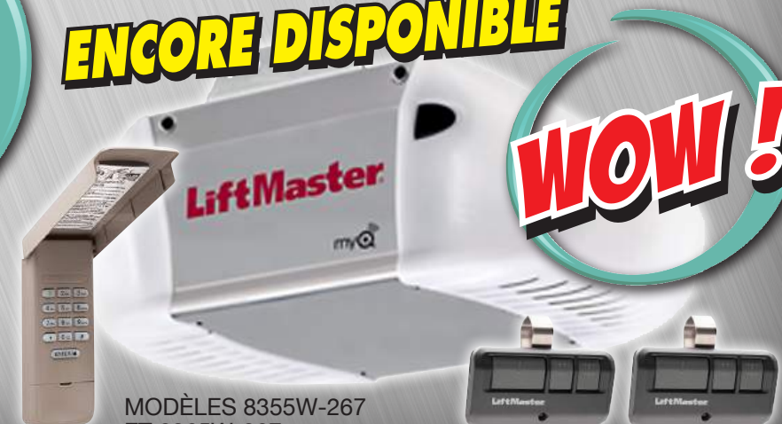
MODÈLES 8355W-267 ET 8365W-267